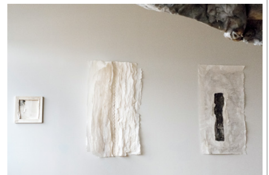
林延，《镇纸》，否画廊场景图