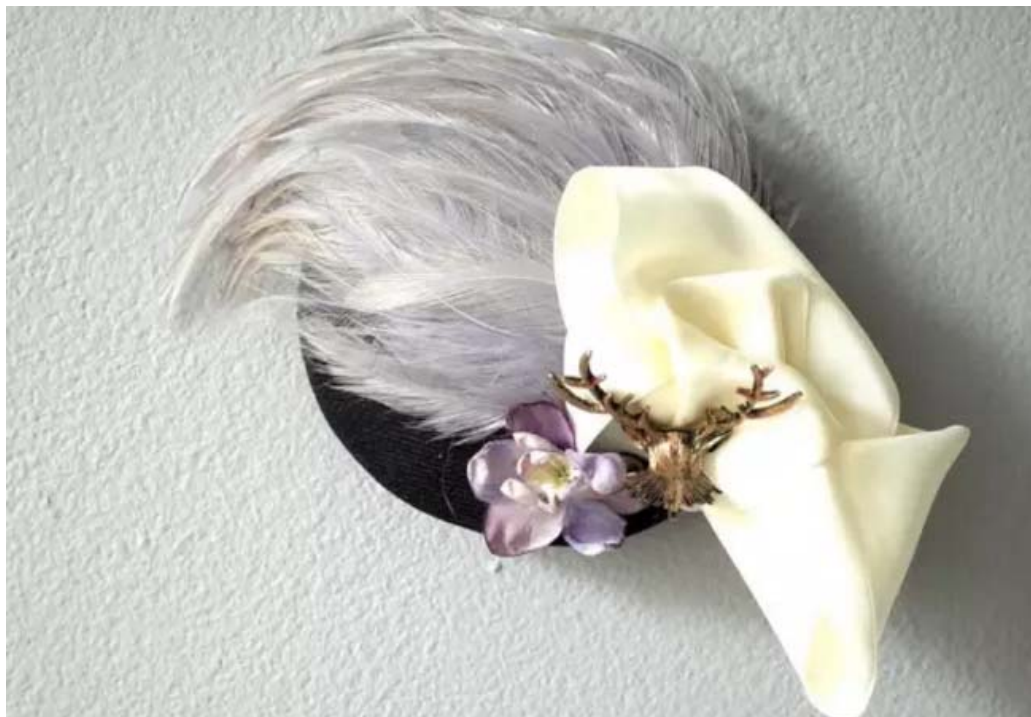
▲ Summer Day - A Tribute to Georgia O'Keeffe 夏日 - 向奥基弗致敬, 2016.